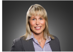
Studiendekanat der FWW