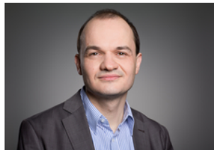
Studiendekan der FWW

Auf den folgenden Seiten erhalten Sie Informationen zu Ihrem Bachelor- oder Masterstudium!